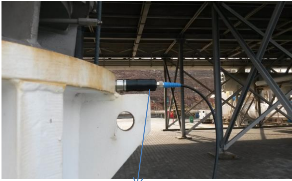
Y yönü (Y side)