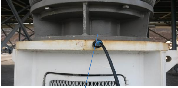
X yönü (X side)