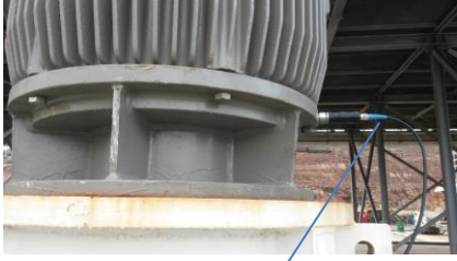
Y yönü(y side)

Motor yatağına en yakın olan bölgeden ölçüm alınır.Emiş hattına dik olan istikamet "x" paralel "y" derinlik ise "z" dir. 3 eksenden ölçüm alınmaktadır.