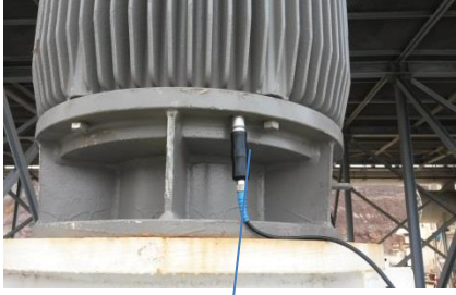
Z yönü (z side)

Motor yatağına en yakın olan bölgeden ölçüm alınır.Emiş hattına dik olan istikamet "x" paralel "y" derinlik ise "z" dir. 3 eksenden ölçüm alınmaktadır.