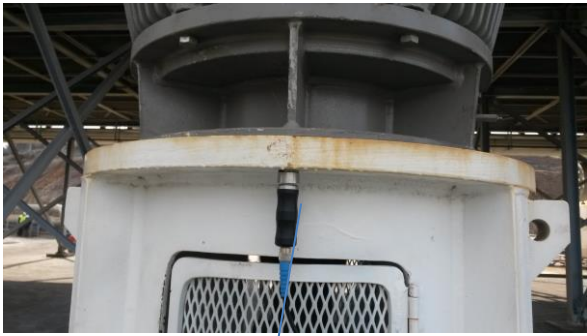
Z yönü (Z side)